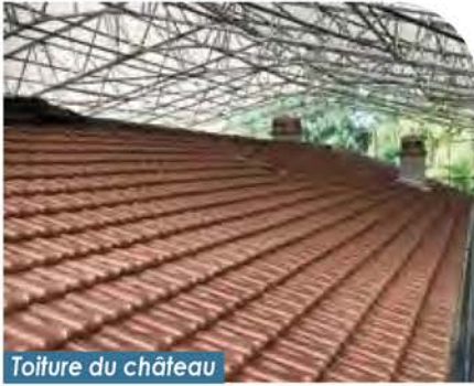
Toiture du château