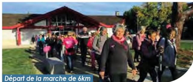
Départ de la marche de 6km