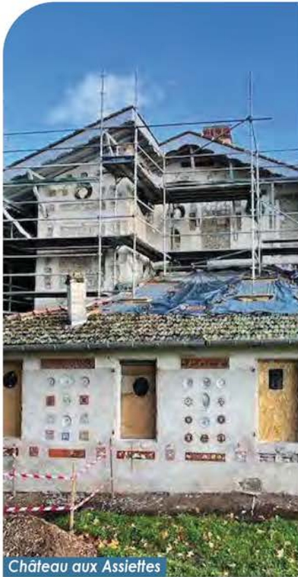
Château aux Assiettes