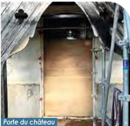
Porte du château