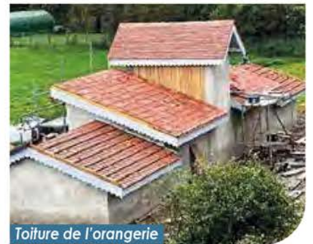
Toiture de l'orangerie

Toutes les fenêtres et volets ont été déposés pour être soit restaurés, soit refaits à l'identique. Ils seront tous en bois et dotés des petits carreaux d'époque.