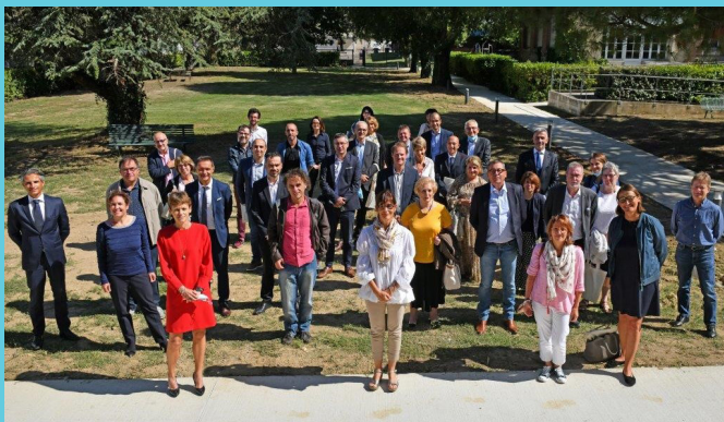
Signature des premières conventions de partenariat avec les Grands opérateurs - Septembre 2020

Dans chaque édition du Petit journal de l'inclusion numérique , cette rubrique détaillera ces différentes solutions.