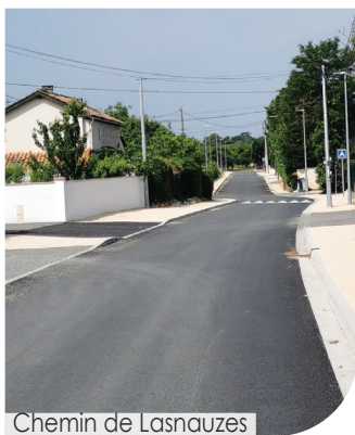
Chemin de Lasnauzes