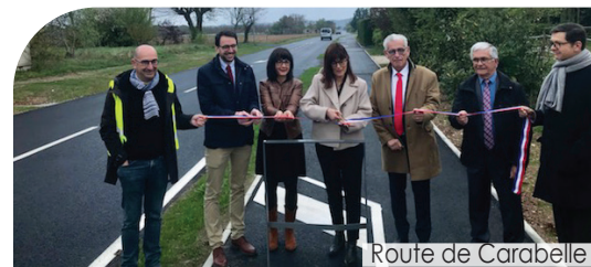
Route de Carabelle