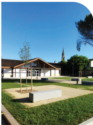
Nouveau parvis salle des fêtes

Cette rue a bénéficié de la création d'un ralentisseur qui rentre dans le cadre d'un plan d'actions sur la commune visant à diminuer la vitesse de circulation des usagers.