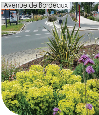
Avenue de Bordeaux

Après 2 printemps, les travaux de fleurissement de l'avenue de Bordeaux et du rond point de Ponservat permettent de bénéficier d'une entrée accueillante sur la commune exceptionnellement colorée et paysagée !