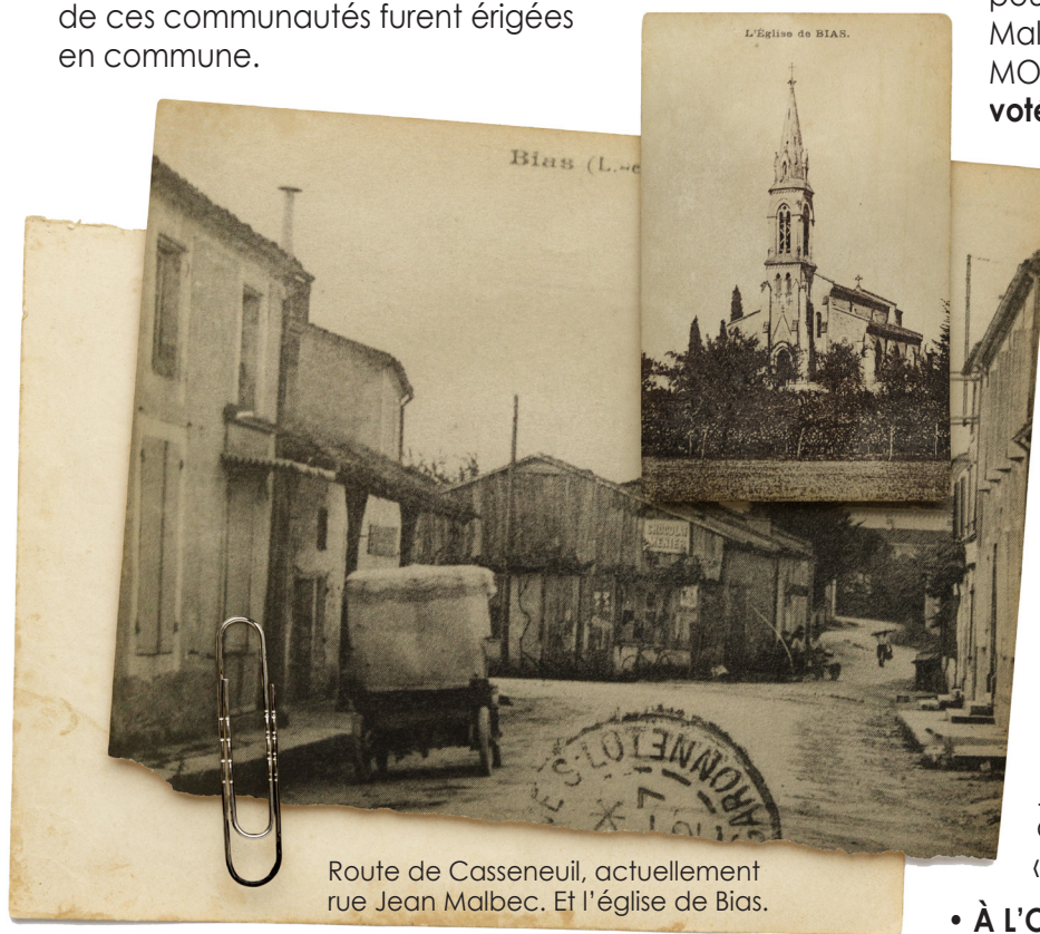
Route de Casseneuil, actuellement rue Jean Malbec. Et l'église de Bias.

Les communes furent établies par les Assemblées Révolutionnaires et la loi du 14 décembre 1789 . La sénéschaussée d'AGEN comptait plus de 500 paroisses administrées par les consuls. La plupart de ces communautés furent érigées en commune.