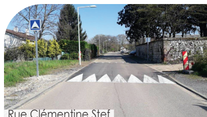
Rue Clémentine Stef

Avec le changement complet du portail de l'entrée, d'une hauteur de plus de 2 m, afin de le rendre infranchissable.