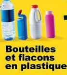
Bouteilles et flacons en plastique