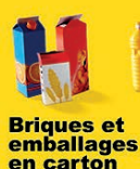
Briques et emballages en carton