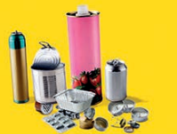
Emballages en métal, même les petits