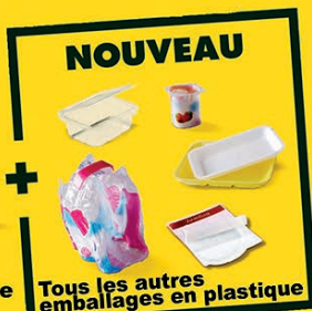
Tous les autres emballages en plastique