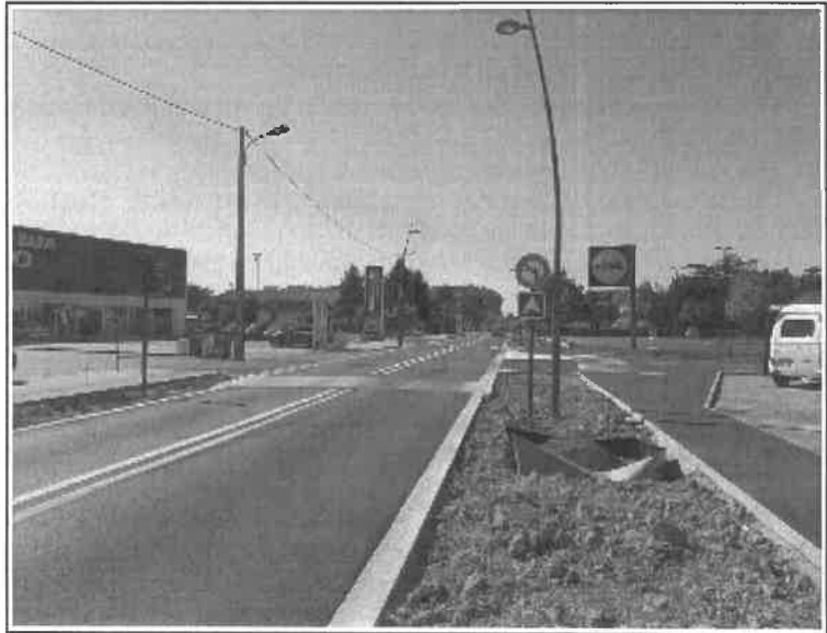
Photo N°01 Avenue de Bordeaux direction STE LIVRADE, zone à 30 km/h passage surelevé.